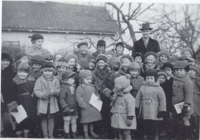
Fem år och i söndagsskolan.

Min uppfattning om mig själv präglades nog i hög grad av de dubbla budskap jag fick från mina äldre syskon. Å ena sidan dyrkade de mig och beundrade mig. Jag talade tidigt och väl. Jag var blond och söt som en kerub. En gång lyfte en av mina bröder upp mig på en stol, tog några steg tillbaka, tittade på mig och sade: "Det där är ingen människa. Det är ett himmelskt väsen." En annan gång stod han som en hök över mig när jag grät och skrek att jag skulle vara tyst. En annan av mina